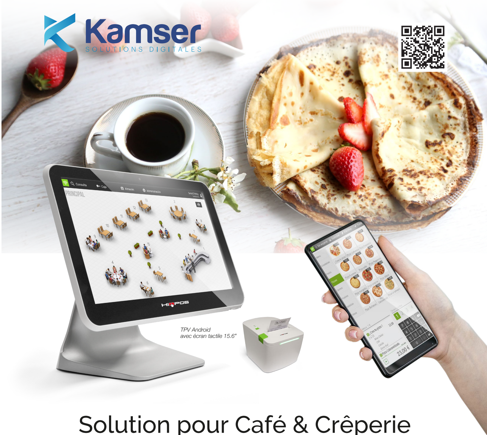
TPV Android avec écran tactile 15.6"