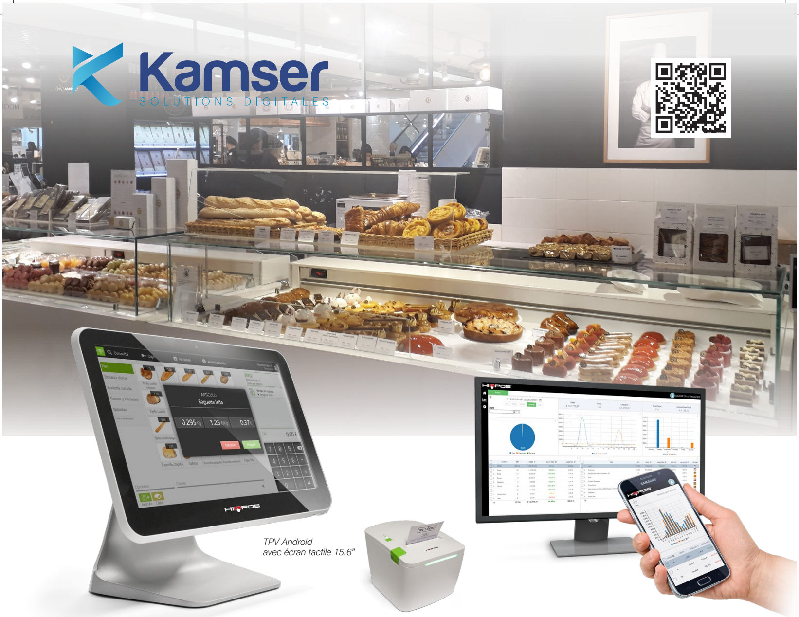
TPV Android avec écran tactile 15.6"