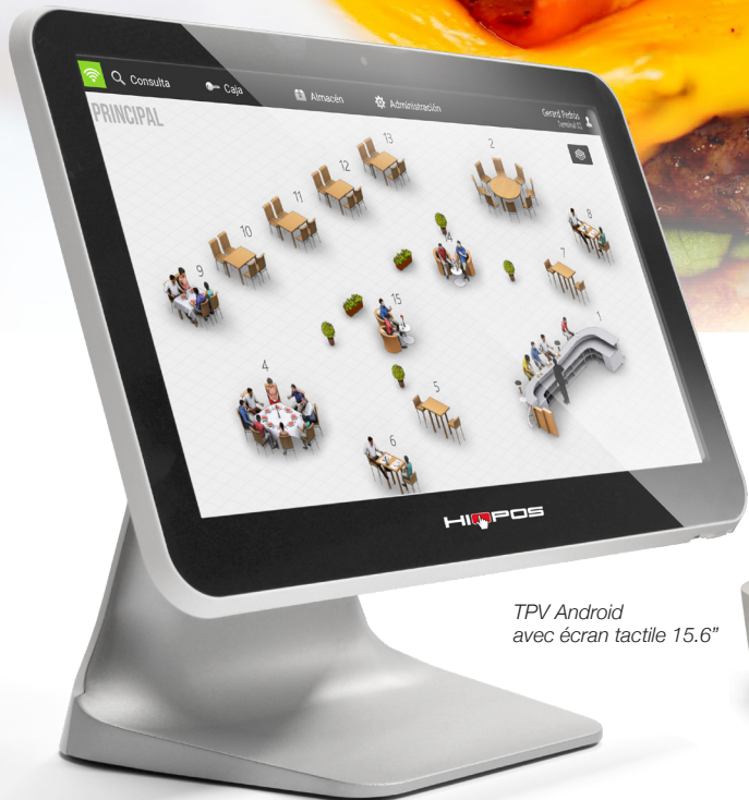
TPV Android avec écran tactile 15.6"