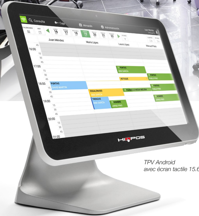
TPV Android avec écran tactile 15.6"